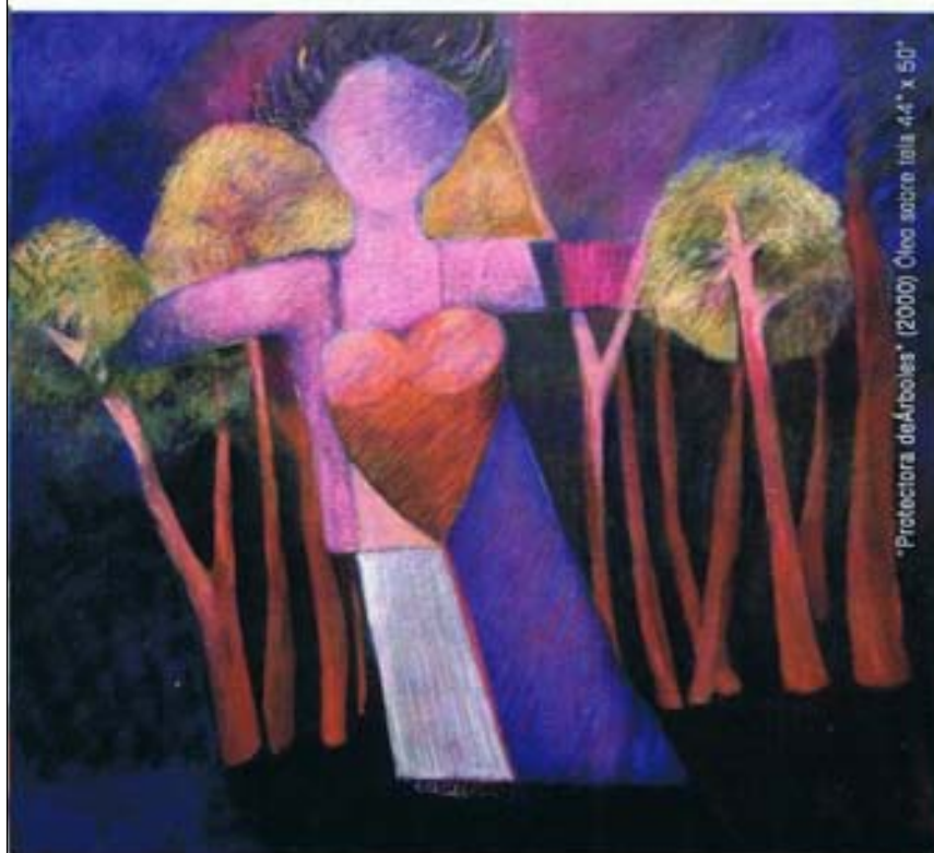
"Protectora de Arboles" (2000) Óleo sobre tela 44" x 50"

1983, la Orden Vasco Núñez de Balboa, otorgada por el Gobierno de la República de Panamá, por su eficaz promoción del arte.